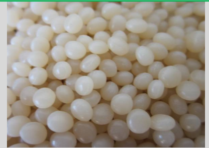
全降解塑膠 PHA 顆粒