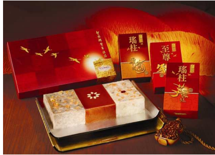
極品賀年年糕禮盒