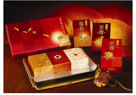
尊貴賀年年糕禮盒