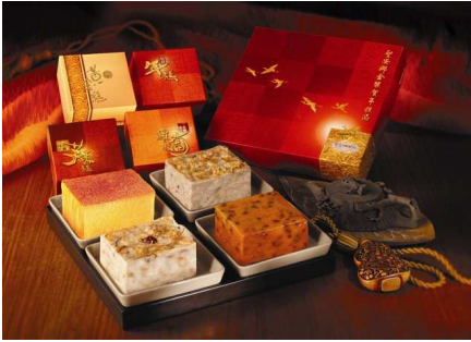
金裝賀年糕品禮盒